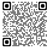
SP-20 Un mensaje a quienes trabajan en instituciones correccionales...