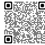
SP-24: Un principiante pregunta...