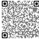
SP-23: A.A. como recurso para los profesionales de la salud